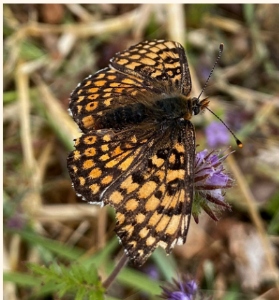
Mélitée du plantain Melitaea cinxia