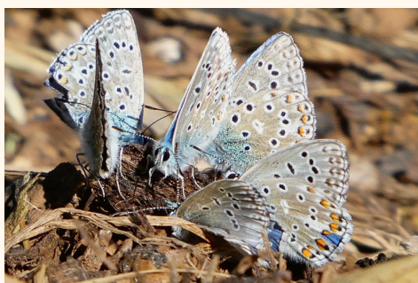
Azuré commun Polyommatus icarus