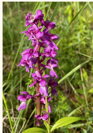
Orchis mâle Orchis mascula