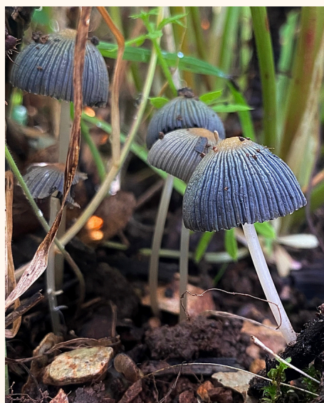
Coprin Parasola sp.