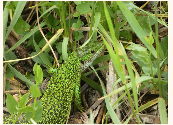
Lézard vert occidental Lacerta bilineata