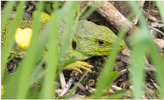
Lézard ocellé Timon lepidus