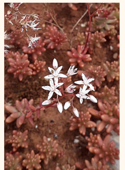
Orpin blanc Sedum album