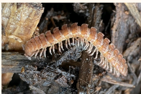
Mille-pattes aplati Pseudopolydesmus sp.