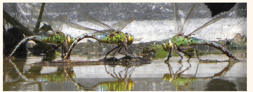
Anax empereur Anax imperator