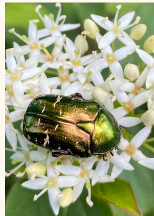
Cétoine dorée et sa larve Cetonia aurata