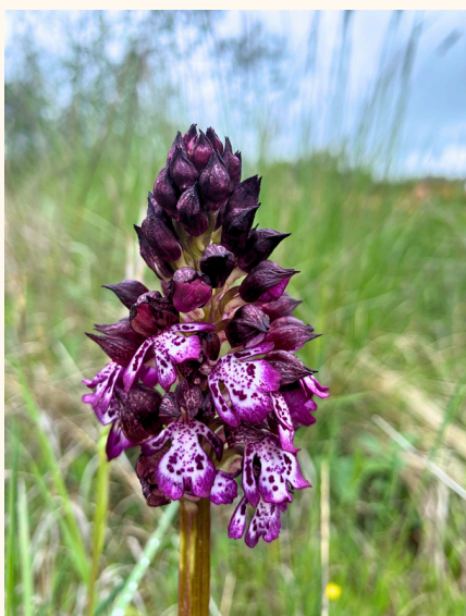
Orchis pourpre Orchis purpurea