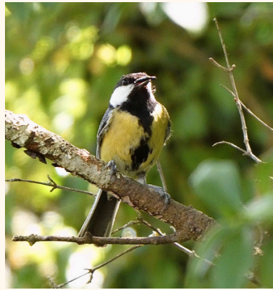
Mésange charbonnière Parus major